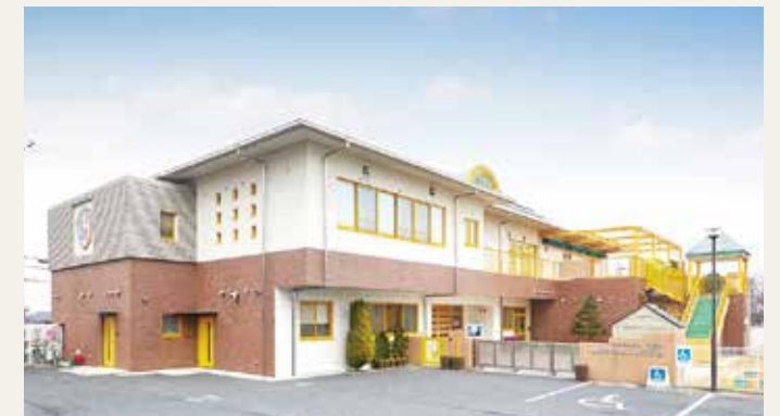
社会福祉法人 裕愛会 幼保連携型こども園