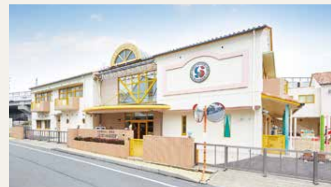
社会福祉法人 裕愛会 幼保連携型認定こども園