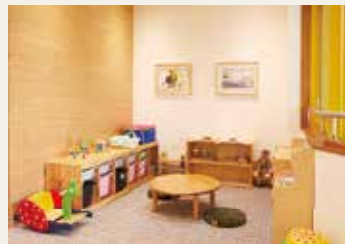
おもちゃ遊びスペース