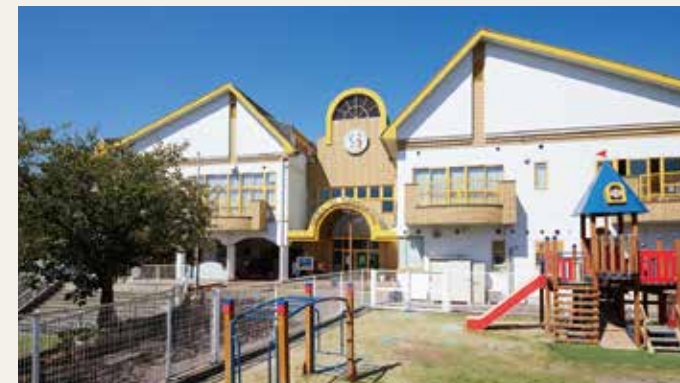
学校法人 誠華学園 幼保連携型認定こども園