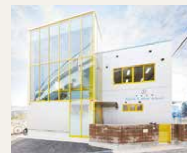
小学生のための学童保育