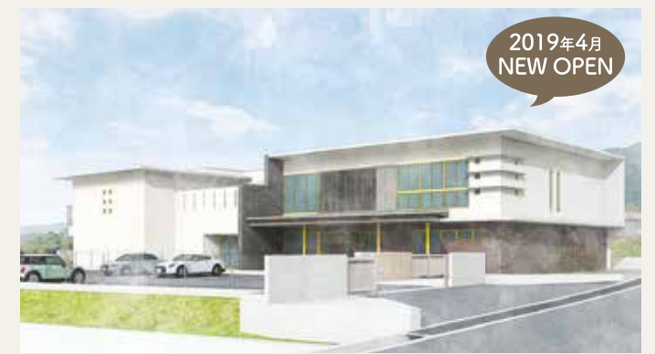
社会福祉法人 裕愛会 幼保連携型認定こども園