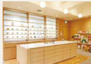
キッチンスペース

マミールームはせいか幼稚園内にある専用の施設です。幼稚園内の空き教室を利用したのではなく、子育てサロンとしてお母さま方が気持ちよく過ごせるように隔々までこだわってデザイン・設計されました。また、子どもの知的好奇心を刺激するような指先あそびのおもちゃや絵本などもそろっています。