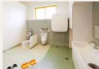
子ども専用トイレ・洗面ルーム